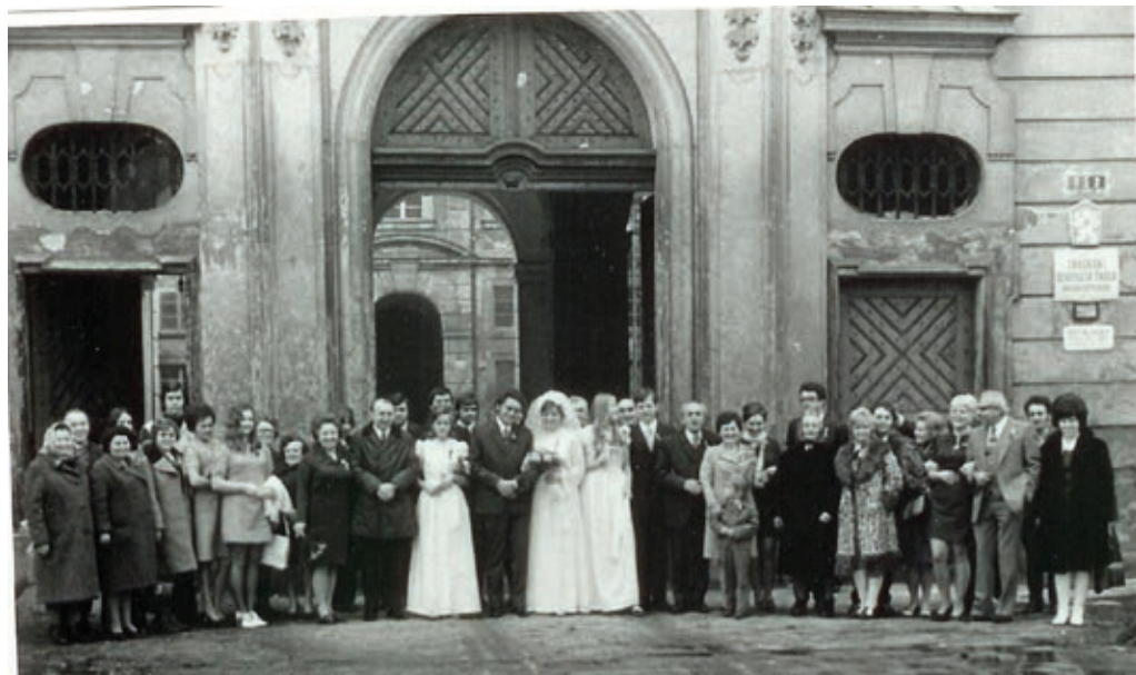
Skupinová fotka před kosmonoským zámekem, který v té době sloužil jako škola. Byl tehdy v žalostném stavu, ale dnes po dlouhých renovacích vypadá skvěle.

No bystrá, rychlá maminka vše zachránila, svatební rada mě v podkrovní ložnici nasoukala do svatebních šatů, které byly ušity poněkud těsně, opatřila mě všemi atributy správné nevěsty, švagrová Milena mi půjčila náramek (správná nevěsta má mít něco vypůjčeného), nasadily mi elegantní závoj a mohlo se vyjet do Kosmonos.