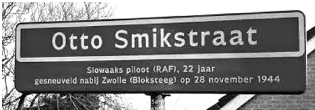
V Holandsku je podlá něho pomeňovaná ulica.

Eleonora Junod-Micatek