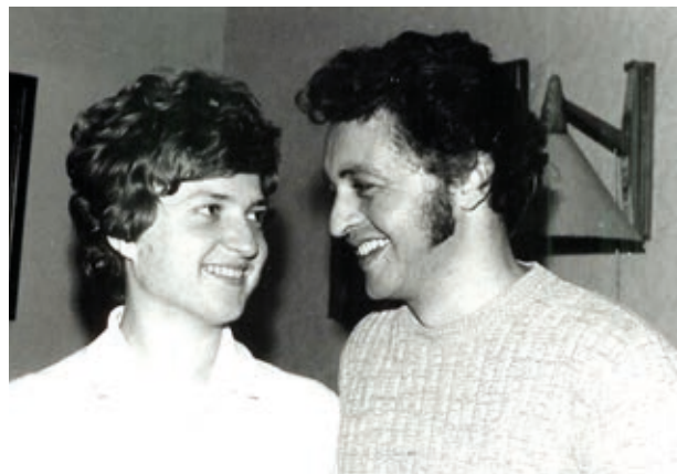
Nahoře: na svatební cestě.