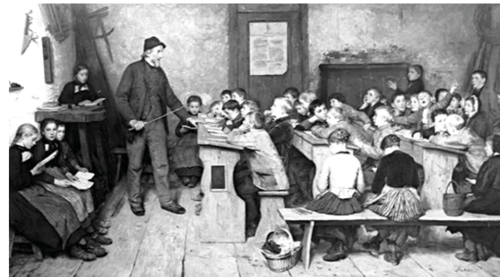
Albert Anker: Vesnická škola.

cyklistické závody. Kilometr jsem běhal hluboko pod tři minuty. Předcvičoval jsem v Sokole při cvičení na náradí atd., ale na vysvědčení to vždy stačilo jen maximálně na stupeň „chvalitebný“. Teprve když jsem se kvalifikoval v „Běhu Rudého práva“ do krajského finále, udělali soudruzi změnu a do kolonky zapsali „výborný“. Opět mě nikdo nikdy během celého studia na gymnasiu nepodrobil nějaké sportovní zkoušce. Otázkou opět zůstává, podle kterých kritérií se známkovalo v době, kdy na stěnách školních tříd visely obrazy prezidenta slovenského původu? Na druhé straně známky z jazyka téměř bratrského – ruštiny, se mi dnes zdají mírné, řekl bych až moc dobré. Nikdy jsem si nemyslel, že umím dobře rusky. Opak byl pravdou. Ruština,