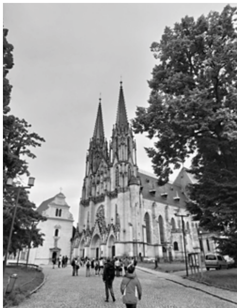
Katedrála sv. Václava na Václavském náměstí.

vářů odbíjejících hodiny a postavičky, dělníků, rolníků, sportovců a pracující inteligence, které se namísto apoštolů točí na malinkém kolotoči, jsou ve skutečnosti mnohem menší, než jak je vidíme na začátku filmu. Ciferník orloje komunističtí reformátoři našťestí nechali nedotčený.