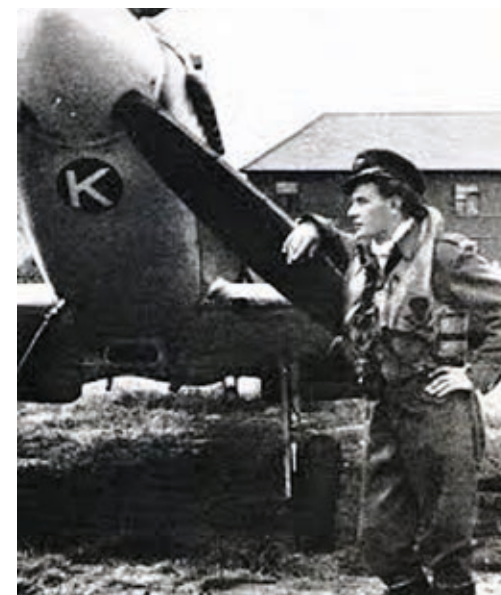
Otto Smik: Najúspešnejší slovenský pilot počas druhej svetovej vojny mal rusko-židovské korene.

Otto Smik 20. januára 1922 – 28. novembra 1977 (22 ročný)