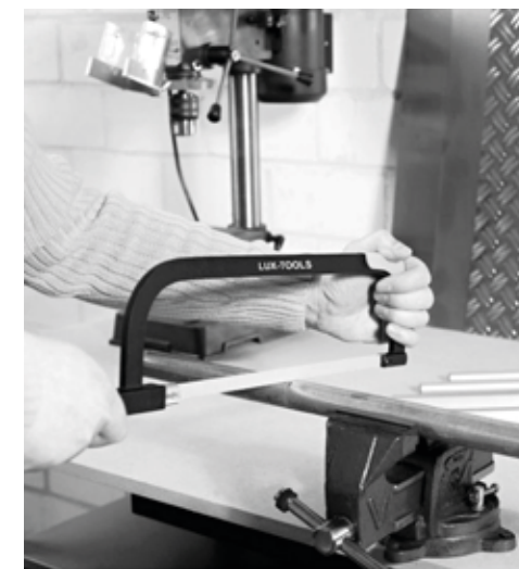
Pilka na železo dlouho nevydržela. chatar-chalupar.cz

K zpestření celodenního pilování přispěla vedle již popsané svačiny opepřené bojem o housky také ranní politická desetiminutovka. Spočívala v tom, že jeden z učňů přečetl nějaký článek z Rudého práva, což byly jediné dosažitelné noviny v továrně, a ostatní učedníci měli o obsahu článku diskutovat a vyptávat se na detaily, což silně převyšovalo jejich intelektuální síly i politickou angažovanost. Tak na příklad na otázku, kolik má vlastně Sovětský svaz vojenských raket, odpověď po dlouhém přemýšlení zněla: „Hodně. Víc než Američani.“ K čemuž soudruh mistr dodal: „Dobře. Proto se sovětům říká stráž míru.“