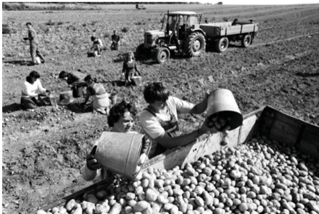
Bramborová brigáda byla za socialismu každoroční povinností mnoha středoškoláků a učňů. S tehdejší technikou by zemědělci brambory určitě neposbírali. elektropiknik.cz

veselá nálada. Ta způsobila, že se děvčata stala přístupnějšími, když jim najednou přestalo vadit velkohubé vytahování jehlařských učňů, kteří po dvanáctce ztratili veškeré zábrany.