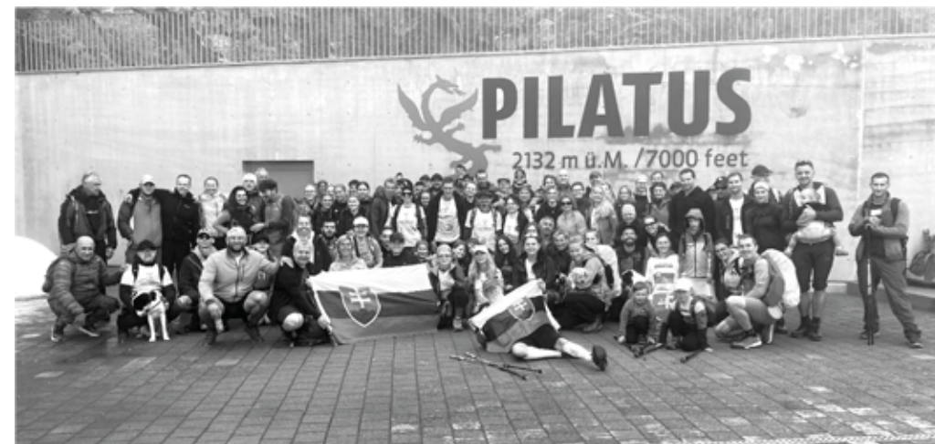
Tradiční fotka na vrcholu této mytické hory.

Michalem Caletkou na Facebooku založená skupina Československý dobročinný výstup na Pilatus spolu s onkologickými klinikami v Brně a Banské Bystrici uspořádaly 23. června již po 13. společný výstup (pěšky) nebo lanovkou na vrchol hory Pilatus (2 132 m. n. m.).