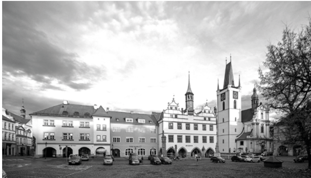
Dějiště tří zvláštních setkání: Mírové náměstí.

Ve výši asi druhého poschodí viselo černobílé velefoto poprsí člověka s odstávajícími ušima v generálské uniformě opentlené četnými stužkami. Zbytek celkového obrazu už nebyl domněnkou ani spekulací: před nízkým podiem přibývalo v intervalech věnců, nahoře plál v kovové míse oheň a u něho, jak se přihlížejícím muselo nutné zdát, se z každé strany přihřívalo po čtveřici čestné stráže, neboť panovala svinská zima. Teatrum tedy nebylo Jiráskovým staroměstským popravištěm, ale určitě něčím jako open-air mučírnu. Střídá-