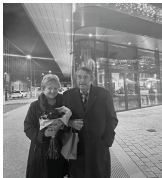
Dole: Oslava zlaté svatby.

zároveň topič, který byl špinavý od uhlí, měl hrb a těžce mluvil. Dovedl nás do pokoje, kde rozsvítil a hned bylo vidět, že pokoj měl hodně daleko do svatebního apartmánu, byla to úzká nudle, kde v protilehlých rozích byly postaveny od sebe