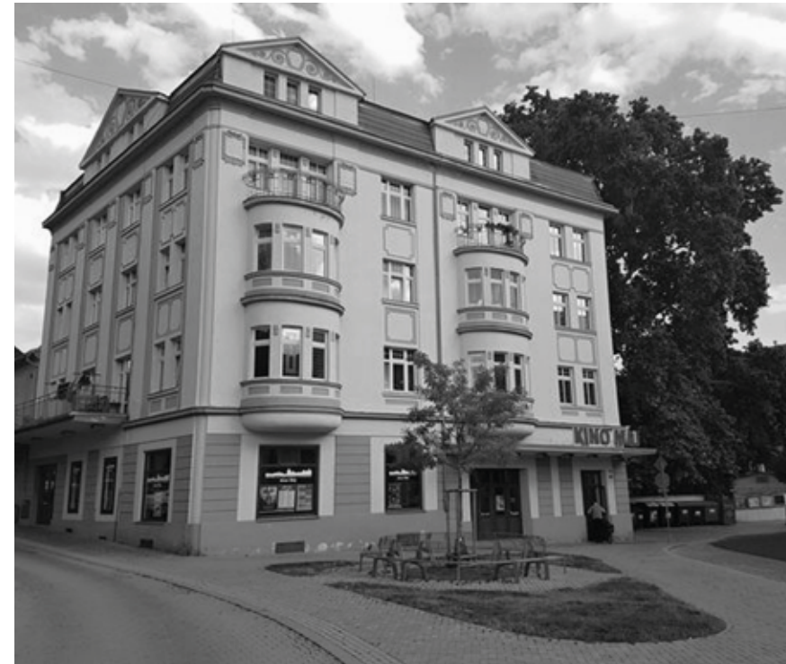
Historické kino Máj, dnešní stav.

ní osmice vyvolených obětí řídil otlý důstojník s černou šerpou přes naditou hrud', který vždy před nástupem nových kandidátů na nachlazení zběžně kontroloval, zda v případě pionýrů a svazáků jim u krku nevyčuhují zpoza nažehlených košil silné svetry, či teplákové bundy.